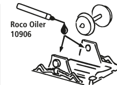
Roco Oiler 10906

Les pièces de finition illustrées sont à monter par le modéliste. Le jeu de pièces peut comprendre d'autres pièces (non illustrées) qui sont destinées à autres versions du modèle et qui sont superflu à la variante présente.